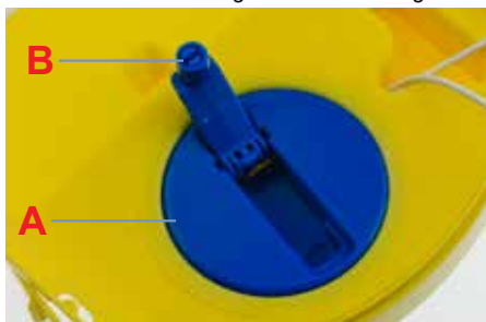
A Aufrollvorrichtung B Kurbel